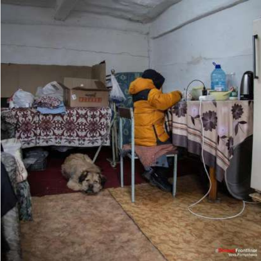
Un rifugio per profughi nella regione del Donbass

si sono rifugiati in ripari di fortuna con le proprie famiglie. Senza dimenticare, comunque, chi è stato costretto a fuggire e probabilmente cercherà ospitalità in altri paesi con i propri animali, inclusa l' Italia . Un piano di interventi a tutto tondo che inizierà a portare, in questo modo, un primo aiuto concreto.