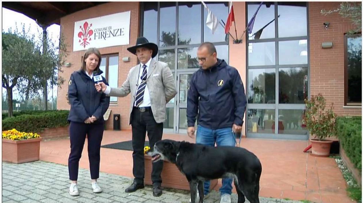
Firenze - Cani scampati alla guerra al canile di Ugnano