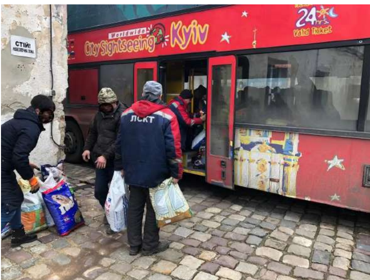
L'arrivo di per food e generi di prima necessità

L'esplosione, la morte dei cuccioli e l'aiuto di Oipa International