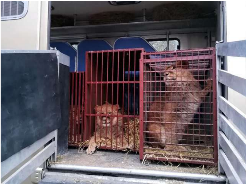
Leoni e tigri trasferiti da un santuario ucraino ad uno zoo MARIAGRAZIA

Supporto a cani e gatti traumatizzati grazie a Cave Canem