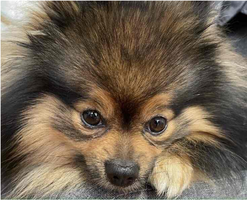
Cane Amore, arrivato dall'Ucraina e accolto da Cave Canem